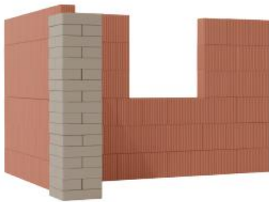
Sol tərəf görünüşü